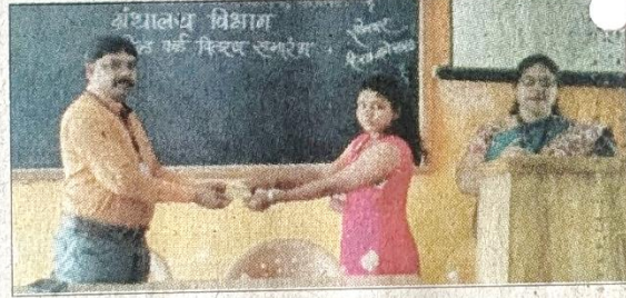
फोंडाघाट : विद्यार्थ्यांना गोल्डकार्डचे वितरण करताना मान्यवर.