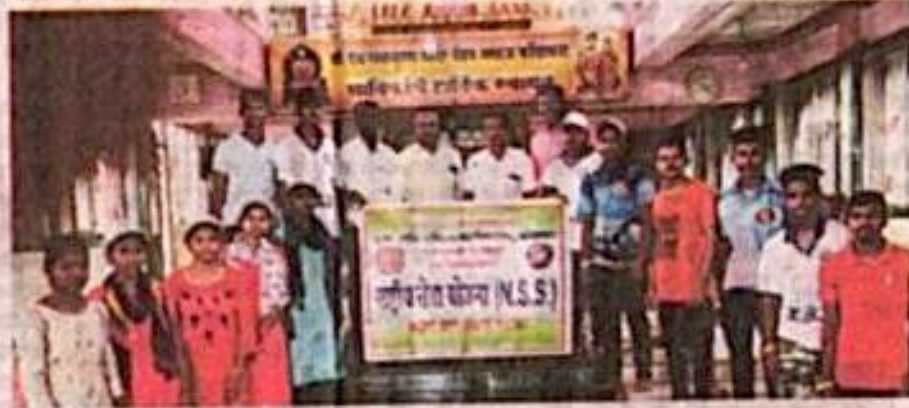
फोंडाघाट कॉलेजच्या राष्ट्रीय सेवा योजनेच्या विभागाच्या विद्यार्थ्यांकडून राधाकृष्ण मंदिर व परिसराची स्वच्छता करण्यात आली. (ऊप: दुम्वार नरन्याणी).

यावेळी मुला-मुलींनी सर्व फिती, फरती आणि सभ्यमंडपाची संपूर्ण स्वच्छता करून पावित्र्याची अनुभूती अधिकांश घडविली. आजवर निघाली शिक्षणअंजलिते घडविले