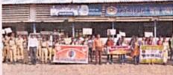
फोंडाघाट महाविद्यालयाच्या विद्यार्थ्यांनी व्यसन विरोधी रॅली काढून जनजागृती केली.

यावेळी विद्यार्थ्यांनी तयार केलेले व्यसन विरोधी जनजागृतीचे फलक लक्षवेधी ठरले. विद्यार्थ्यांनी ३१ डिसेंबर - नो बीअर, नो चिअर, 'दारूने झिंगला - संसार भंगला' अशा अनेक व्यसन