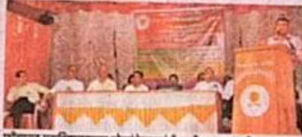
फोंडाघाट महाविद्यालयाच्या स्नेहसंमेलनप्रसंगी माजी खासदार सुधीर सावंत यांनी मनोगत व्यक्त केले.

फोंडाघाट येथील कला आणि वाणिज्य महाविद्यालयाचे वार्षिक स्नेहसंमेलन व पारितोषिक वितरण समारंभ सगळेभावेळी प्रमुख पाहुणे म्हणून सुधीर सावंत उपस्थित होते. ते