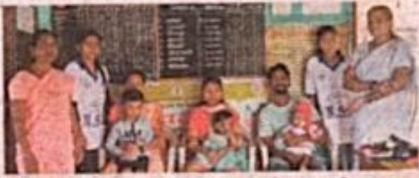
फोंडाघाट येथे बालकांसाठी लसीकरण मोहीम राबविण्यात आली.