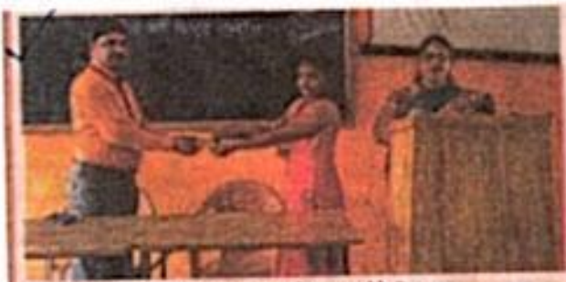
फोंडाघाट : येथील महाविद्यालयात गोल्ड कार्डचे वितरण.