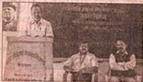
मराठी विषय आणि व्यवसाय संधी या विषयावर मार्गदर्शन करताना मान्यवर.