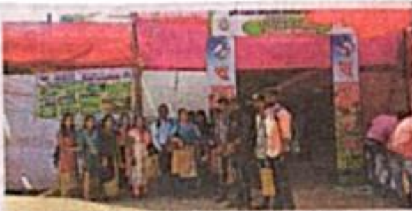
वैभववादी : येथील कृषी प्रदर्शनाला फोंडाघाट महाविद्यालयाची तरुणांनी भेट देऊन पाहणी केली.