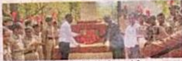
फोंडाघाट महाविद्यालयाच्या एनसीसी कॅडेट्सनी करूळ येथील हुतात्मा स्मारकास भेट दिली.

त्यानंतर महाविद्यालयातील एनसीसी कॅडेट्सनी करूळ येथील