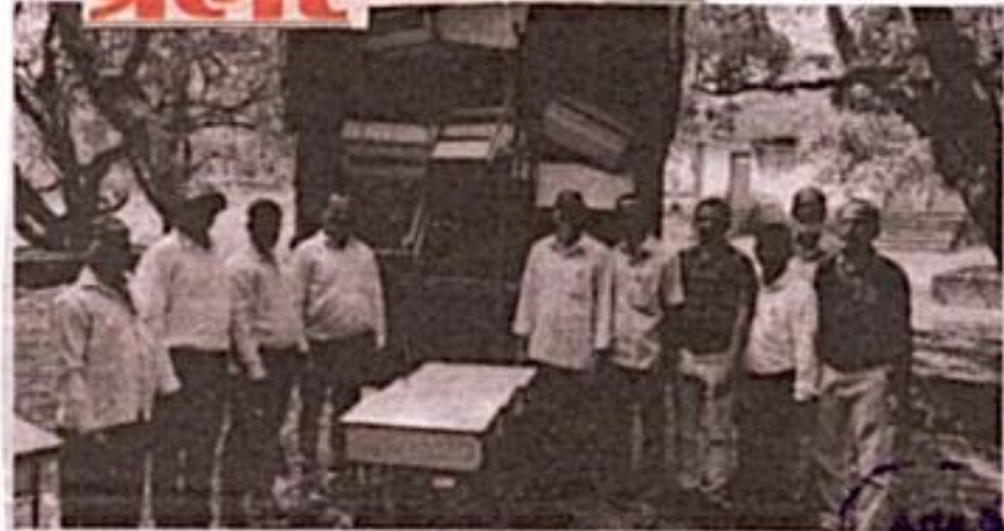
फोंडाघाट महाविद्यालयाला देणगी देण्यात आली. (छाया कुमार नळदरणी).