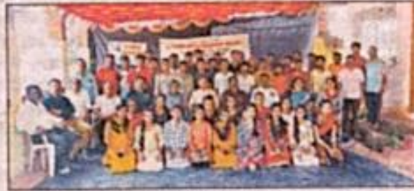
फोंडाघाट : एन. एस. एस. विभागाच्या निव्वामी शिबिराच्या सांगताप्रसंगी उपस्थित विद्यार्थी व शिक्षक.