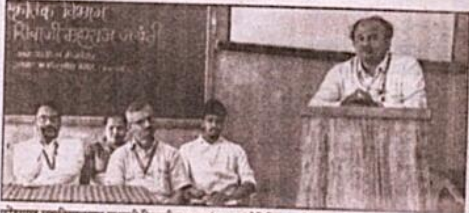
फोंडाघाट महाविद्यालयात छत्रपती शिवाजी महाराजांच्या जर्नलीनिमित्त आयोजित कार्यक्रमात बोलताना प्राचार्य.