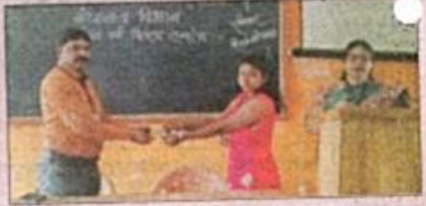
फोंडाघाट : विद्यार्थ्यांना गोल्डकार्डचे वितरण करताना मान्यवर.

वार्ताहर फोंडाघाट फोंडाघाट कला आणि कवियत्र महाविद्यालयाच्या प्रेक्षासमापन गोल्ड कार्डचे वितरण मुकेश्वर करण्यात आले. महाविद्यालयातील विविध मुलकात पाहू विद्यार्थ्यांना हे गोल्ड कार्ड दिले जाते. त्यामुळे त्या विद्यार्थ्यांना महाविद्यालयाच्या कार्यसमापन समेत न राहता, त्याची सापणी भूय केली जाते. प्रेक्षासमापन वेळीच्या विद्यार्थ्यांच्या दुसऱ्या मुलकात मिळताना त्यामुळे त्या विद्यार्थ्यांना अभ्यासासाठी उत्तम सुविधा मिळते. विद्यार्थ्यांमध्ये सुरास निर्माण झाली ही त्याची श्रेष्ठिक प्रगती होते. असा महाविद्यालयाचा उद्देश आहे, असे प्रास्ताविकाने प्रेक्षासमापन विद्या मोदी यांनी सांगितले.