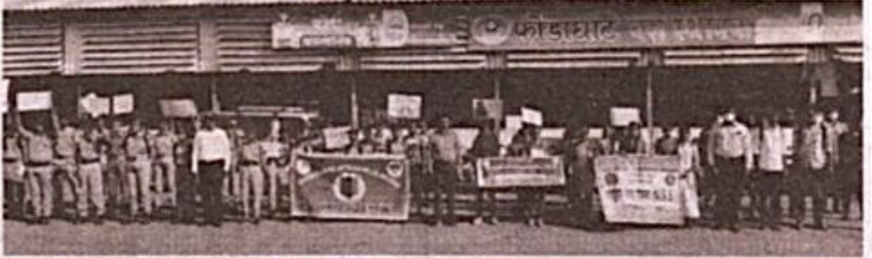
फोंडाघाट महाविद्यालयाने व्यसन विरोधी जनजागृती रॅली फोंडाघाट बाजारपेठेतून काढली. (छात्र सुभार नाडकणी)