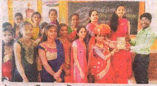
लोकराजा शाह संविधान संवाद प्रशिक्षण केंद्राच्यावतीने सावित्री वदते ही पुस्तिका भेट देण्यात आली.